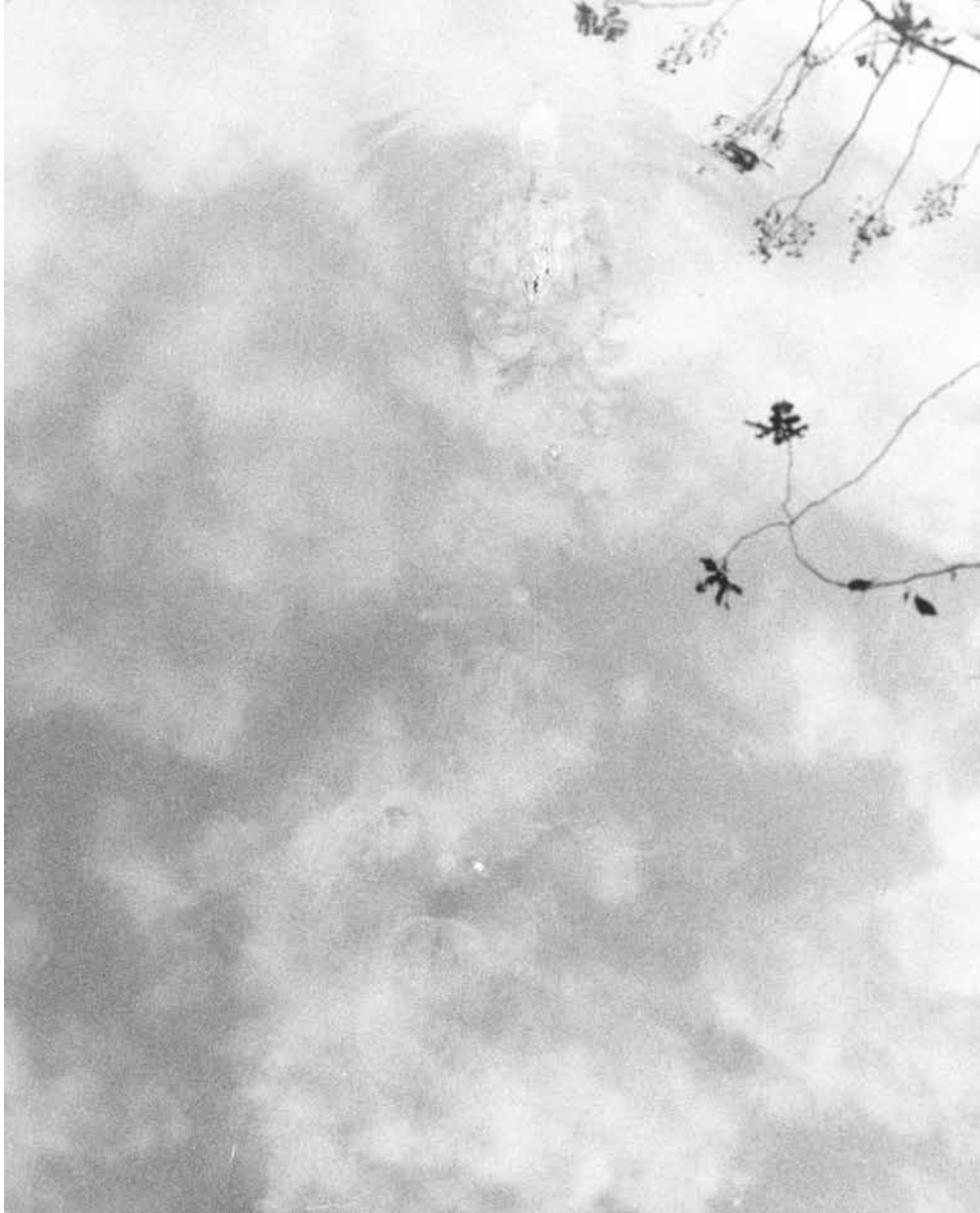
Jochen Lempert , Sans titre , 2008 Tirage gelatino-argentique, Ed. 2/5. 75,5 x 55 cm

+ 115-117 RUE LA FAYETTE F-75010 PARIS +33 (0)9 5102 5188