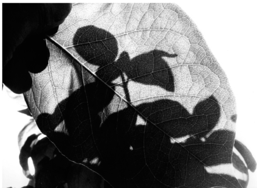
Jochen LEMPERT , Sans titre , 2009 tirage gélatino-argentique, 24 x 30 cm. Ed. 2/5.