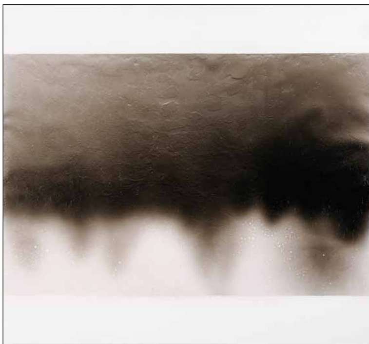
Philippe CAURANT , Sans titre , 2007

Installation, amplificateur, haut-parleur, platine disque, dub plate, fil, dimensions variables