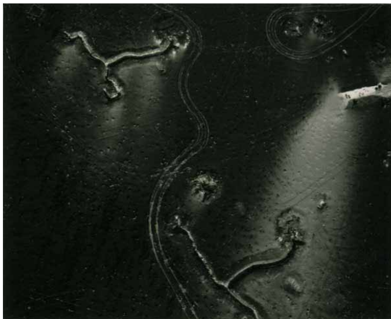
Sophie RISTELHUEBER , Fait (71) , 1992 tirage argentique monté sur aluminium, avec cadre ciré or 100 x 130 x 5 cm. Ed. 2/3.

+ VISUELS DISPONIBLES POUR LA PRESSE (haute définition libre de droits)