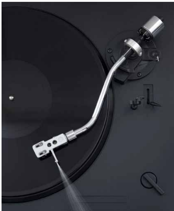
Bertrand LAMARCHE , Sans titre , 2008

GALERIE + POGGI & BERTOUX OBJET ASSOCIÉS DE + PRODUCTION