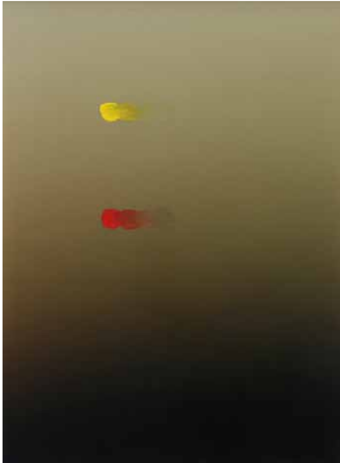
Pieter VERMEERSCH, sans titre , 2011, Peinture acrylique sur tirage photographique lambda 56 x 76 cm

+ 115-117 RUE LA FAYETTE F-75010 PARIS +33 (0)9 5102 5188