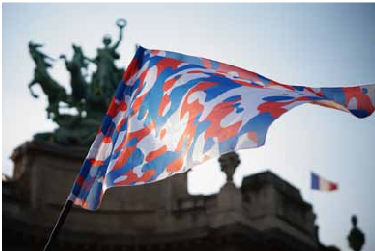
Société Réaliste, UN Camouflage (France) , 2012, 100 x 150 cm