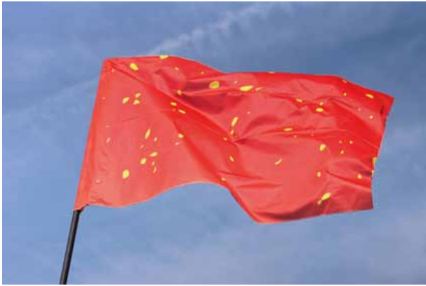
Société Réaliste, UN Camouflage (Chine) , 2012, 100 x 150 cm