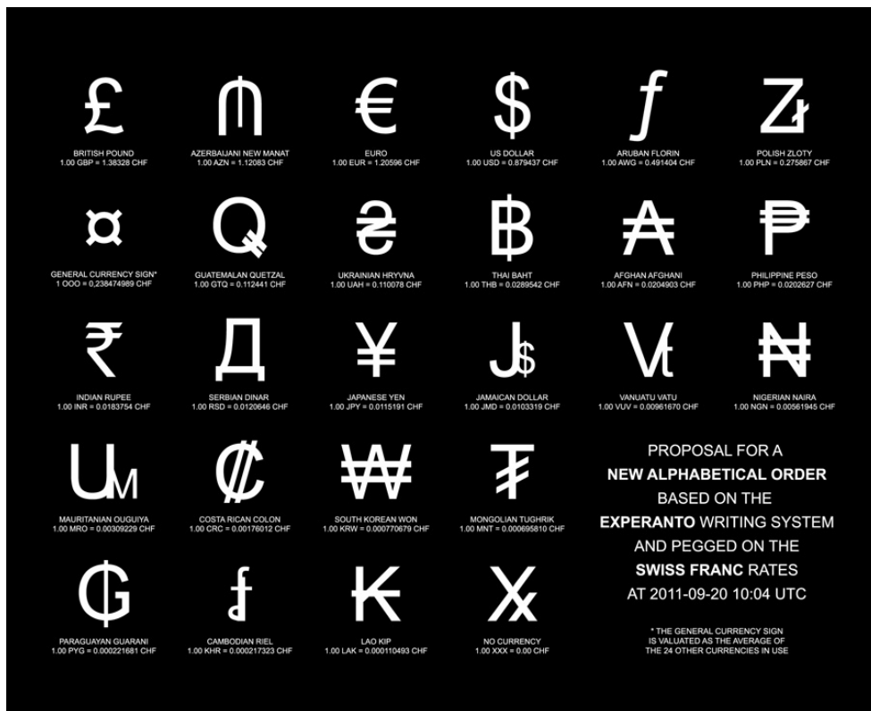
Société Réaliste, Proposal for a New Alphabetical Order... 2009-2012, Plaque émaillée, 80 x 65 cm