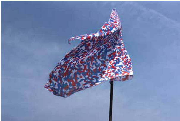
Société Réaliste, UN Camouflage (États-Unis) , 2012, 100 x 150 cm