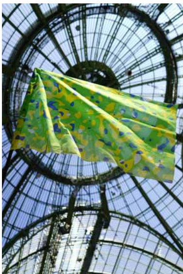
Société Réaliste, UN Camouflage (Brésil) , 2012, 100 x 150 cm