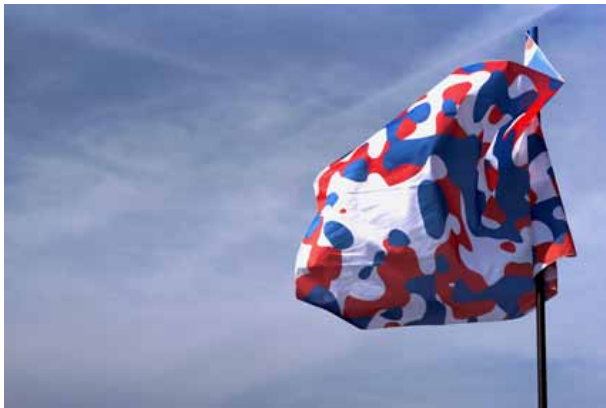
Société Réaliste, UN Camouflage (France) , 2012, 100 x 150 cm