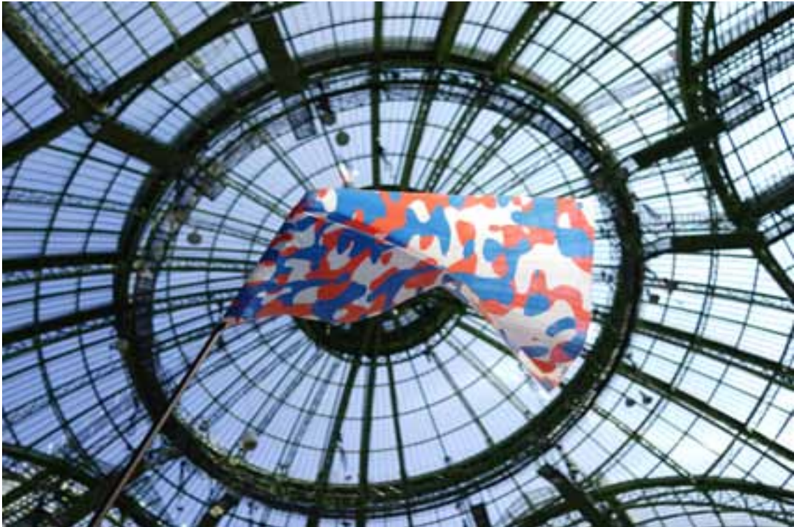
Société Réaliste, UN Camouflage (France) , 2012, 100 x 150 cm