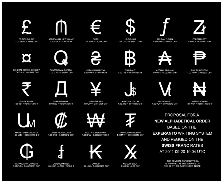
Société Réaliste, Proposal for a New Alphabetical Order ... , 2009-2012, Plaque émaillée, 80 x 65 cm

Leurs oeuvres interrogent le rapport de notre société à un savoir encyclopédique moins rationnel et objectif qu'il n'y paraît, soumis à l'influence de leur environnement politique, économique et culturel. Elles révèlent également ce que le savoir peut avoir de subjectif aussi bien dans son enseignement que dans sa réception, se situant sur la frontière parfois ténue qui existe entre enseignement et endoctrinement, instruction et propagande, concept et précepte. Mais aussi ce que l'acte d'enseigner et celui d'apprendre peuvent avoir de poétique.