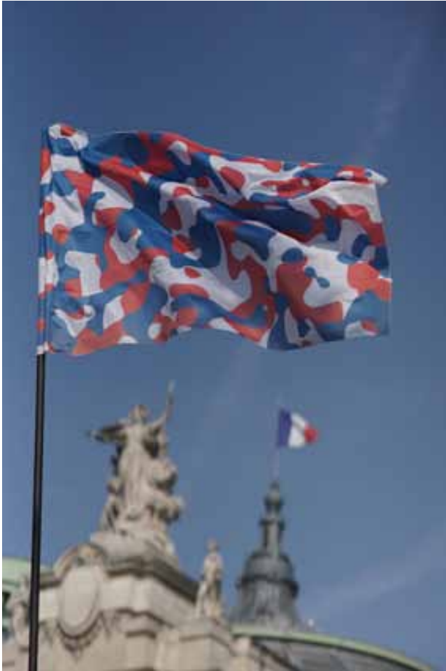
Société Réaliste, UN Camouflage (France) , 2012, 100 x 150 cm Crédits photo Christophe Brachet Courtesy Galerie Jérôme Poggi, Paris