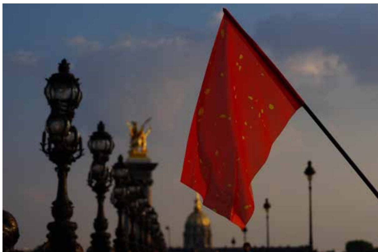
Société Réaliste, UN Camouflage (Chine) , 2012, 100 x 150 cm