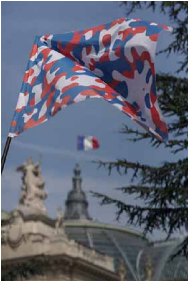
Société Réaliste, UN Camouflage (France) , 2012, 100 x 150 cm