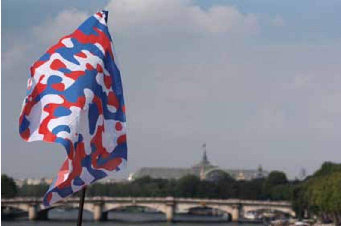
Société Réaliste, UN Camouflage (France) , 2012, 100 x 150 cm