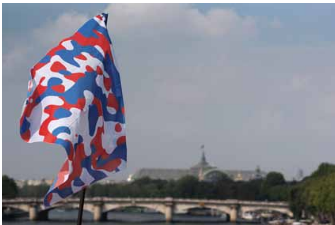
Société Réaliste, U.N. Camouflage 2012, 193 drapeaux de 150 x 100 cm.

A l'occasion des quarante ans de la FIAC, Société Réaliste installe l'oeuvre monumentale UN Camouflage (2012) sur la passerelle Léopold Sedar Senghor, reliant le Louvre et le Jardin des Tuileries aux berges de la Seine nouvellement aménagées sur la rive gauche. Hissés à six mètres au dessus de la passerelle se déploie l'ensemble des drapeaux des états membres des Nations Unis transformés en motifs camouflage.